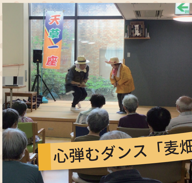
心弾むダンス「麦畑」

活気にあふれる、楽しいイベントとなりました。 ご参加いただいた皆さま、誠にありがとうございました！